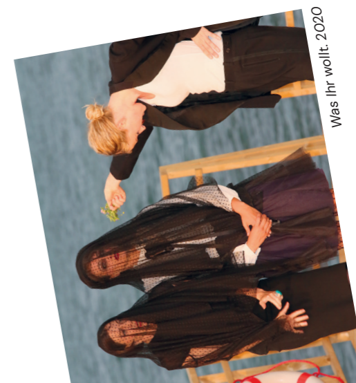
Was ihr wollt. 2020