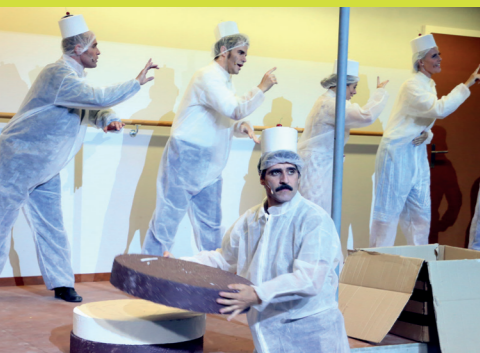
Die Schweizermacher. 2021

Der Gönnerverein versteht sich als aktiver Freundeskreis des See-Burgtheaters und gibt Ihnen Gelegenheit, Kultur nicht nur zu unterstützen, sondern selbst dazugehören.