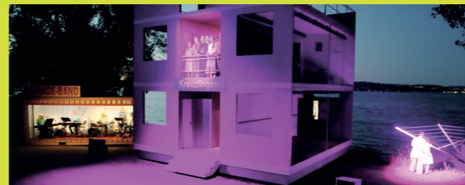
Die Schweizermacher. 2021

Die Seebühne befindet sich am Ufer des Bodensees im Seeburgpark Kreuzlingen, in einer der schönsten Seeuferanlagen Europas.