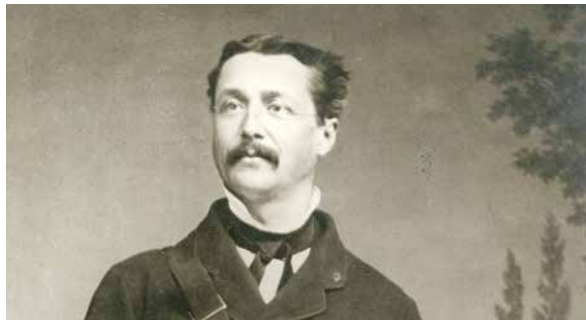
Joseph Victor von Scheffel Fotografie von 1864