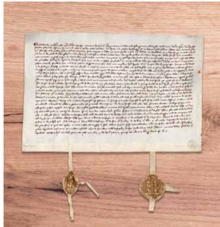
Die älteste Abschrift der Stadtrechtsurkunde von Radolfzell aus dem Jahr 1344, Generallandesarchiv Karlsruhe.

Radolfzell wurde Hauptumschlagplatz des Reichenauischen Warenverkehrs nördlich und westlich des Sees. Kauf-