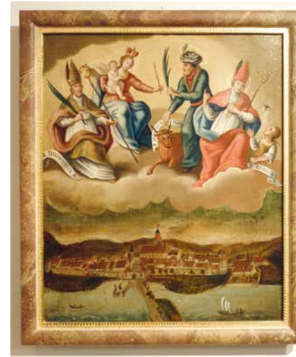
Die Hausherren thronen über Radolfzell, Stadtmuseum Radolfzell.

Im Jahre 840 gab Radolf schließlich seinen Bischofssitz in Verona auf und begab sich an seinen Alterssitz nach Radolfzell, wo er sieben Jahre später verstarb. Seinen Sarkophag kann man noch heute im Radolfzeller Münster betrachten.