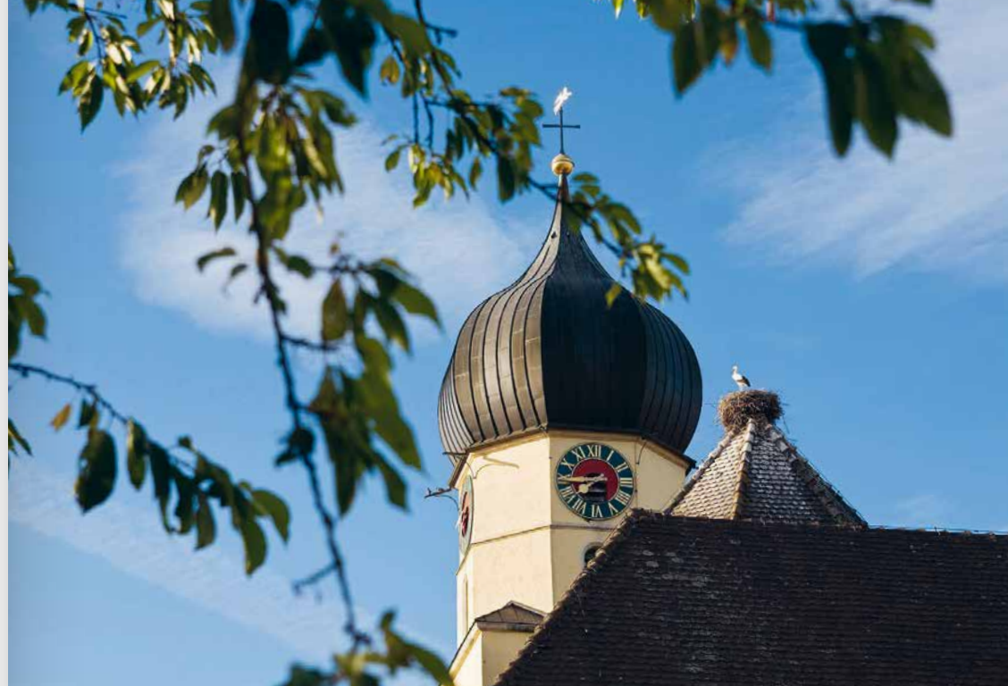
Der Ortsteil Böhringen ist mit derzeit 20 Storchepaaren die Storchenhauptstadt des Bodensees.

Im s'Bokle steht das alljährliche Mittelalterspektakel „Carpe Noctem“ dieses Mal ganz im Zeichen der Radolfzeller Geschichte. Die Gäste können sich ins tiefste Mittelalter zurückversetzen lassen und bei Spielen, Show-Kämpfen, Speis und Trank und vielem mehr Radolfzeller Geschichte live erleben. Beim bunten Tavernentreiben können die Besucher wichtige Figuren aus der Radolfzeller Vergangenheit hautnah kennen lernen und so mit viel Spaß Radolfzell geschichtlich erfahren.