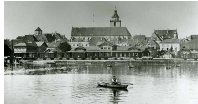
Das alte Gesicht von Radolfzell.