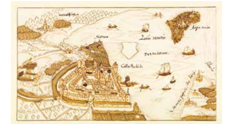
Radolfzell mit Untersee und Reichenau, Federzeichnung um 1560, Kunsthalle Karlsruhe

Die herausragende Stellung Radolfzells im regionalen Umfeld hatte zur Folge, dass Anfang des 17. Jahrhunderts die Verwaltung der Reichsritterschaft im Hegau in Radolfzell ihren Sitz im Ritterschaftshaus, dem heutigen Amtsgericht, fand.